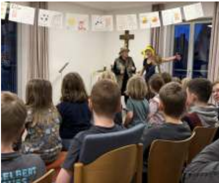
Betthupferwoche im Gemeindehaus in Memmelsdorf: